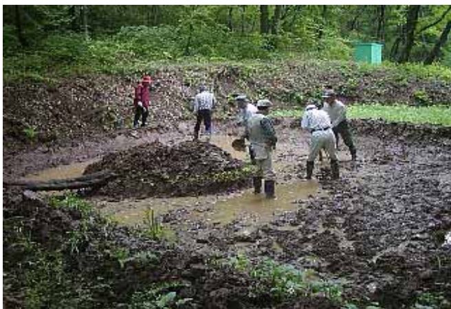
休耕田を掘り下げて溜池づくり