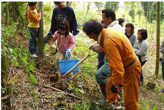
子どものタケノコ掘体験