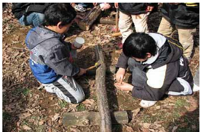
冬の里山体験イベントの中で椎茸の植菌作業を体験