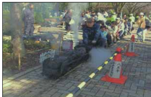
たくさん子ども達を乗せて実際にSLが動きます