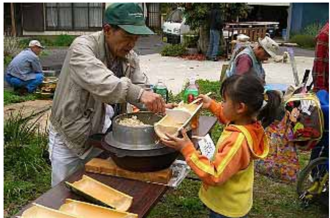
手作りの竹の器で頂く薪炊きのタケノコご飯