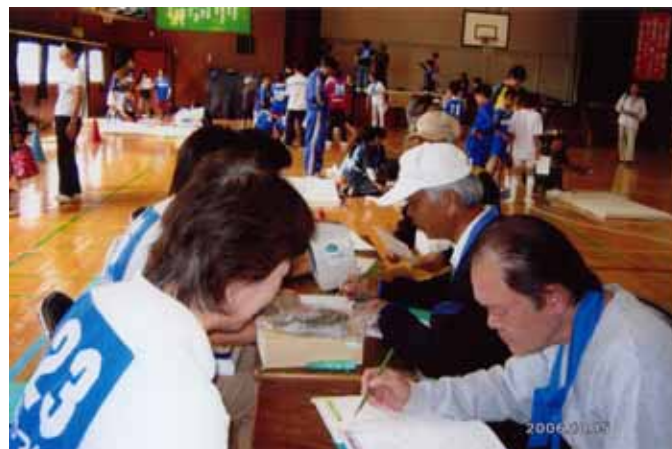
おたっしゃ21 健診風景