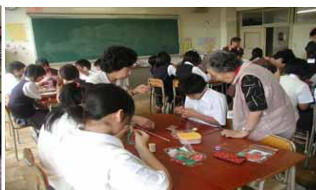
加住中学校 暑いなか一生懸命頑張りました