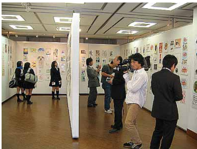
「作品審査会の様子」