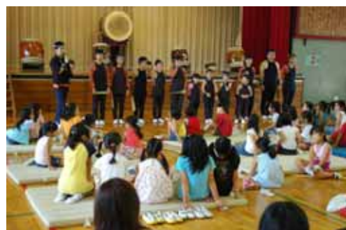
サタデースクール（和太鼓）