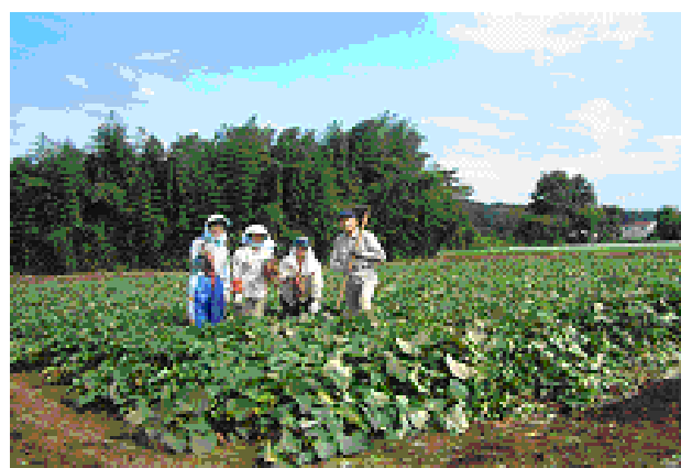
サツマイモ 収穫作業