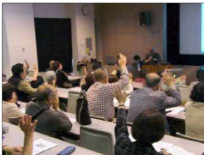
盛況の講座の様子