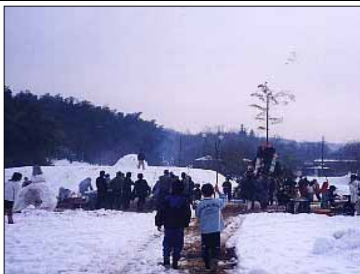
宇津貫歳時記「まゆ玉焼き」