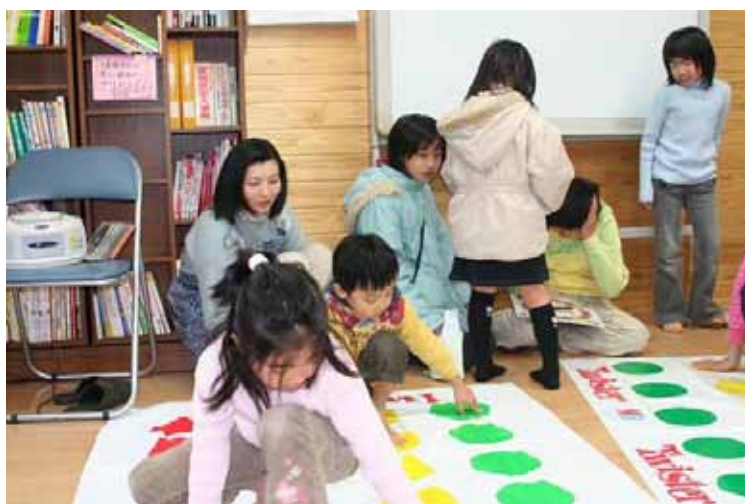
「楽しく遊ぶある日の～居場所～」