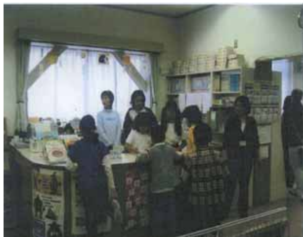
八王子市立大和田小学校見学の様子