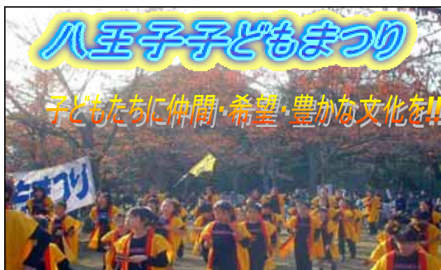
中央舞台では子ども達が元気いっぱい