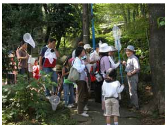
同じく夏編 フィールドワーク風景