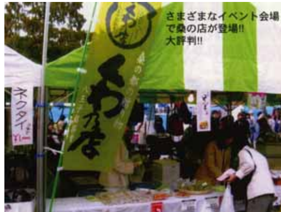
いちょう祭り「ふるさとバザール会場」にて