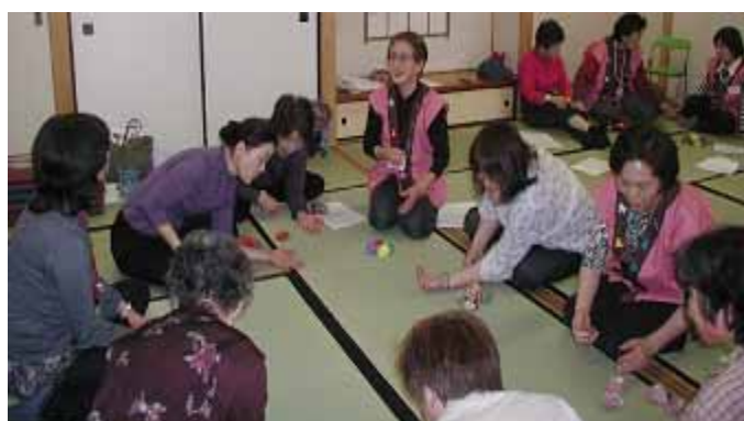
寄せだま 講習会 童心に返って