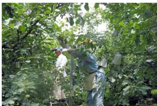
りんご袋かけのお手伝い