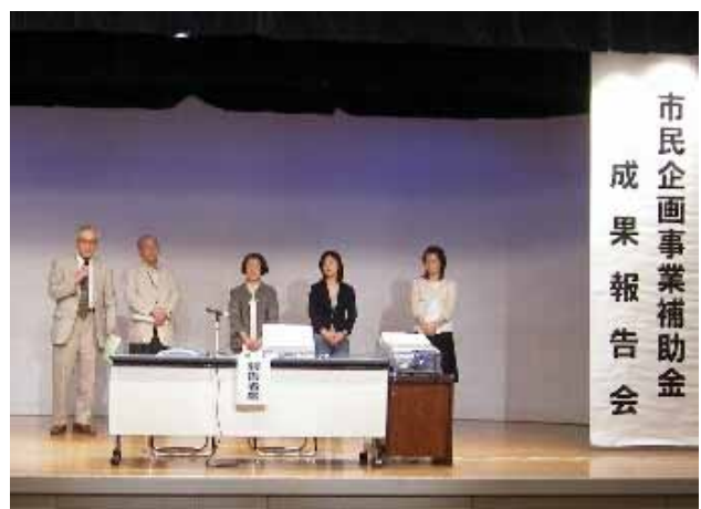
成果報告会における審査員講評の様子

最後に、この市民企画事業補助金制度は、従来の補助金体系の見直しから生まれた、「税の再配分」の新たな方式であるが、今後さらに見直しが必要になるのではないかとこの点である。今回の成果報告会もそうであるが、10月に行なわれる情報交換会も含めて、市役所の協働推進課がいつまでも実質的な事務局を担うことが望ましいのだろうか。私見では、むしろ市としての補助金を「基金」に組み替え、中間支援組織が「助成金」の形で再配分し、情報交換会や成果報告会も中間支援組織が開催・運営した方がよいのではないと思われる。「カイザルのものはカイザルへ」ではないが、「市民社会のものは市民社会のなかへ」という形が望ましい。