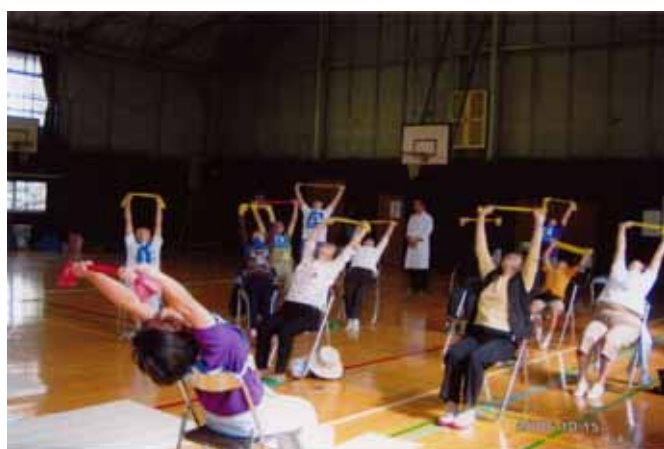
セラバンド体操風景