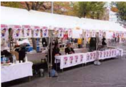
パン販売など（お披露目会にて）