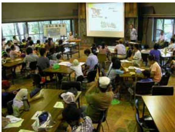
平成18年8月 四季の植物誌 夏編 講義風景