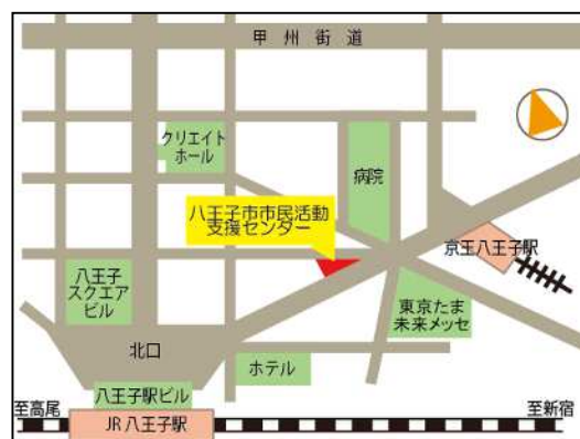
【当センター位置図】JR八王子駅から徒歩5分