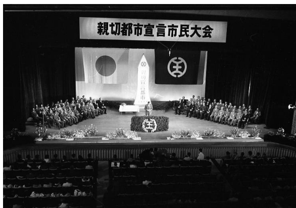
(上)市民会館で行われた「親切都市宣言市民大会」のようす。

昭和36年(1961年)8月の親切会結成以来、各種の実践活動が続けられ、「『親切都市』を宣言するには、それにふさわしい力をつけてから」という誓いを達成し、秋にオリンピック自転車競技が開催されることをひかえて、親切運動が平和と友好を願う世界の人々の心を打ち、世界平和の基となることを信じ、「親切都市」宣言となりました。