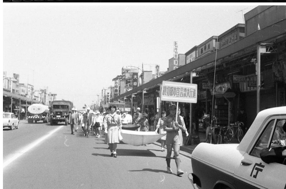
(下)大会に向け、市民による行進が行われた。