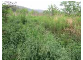
▲十分に活かされていない農地