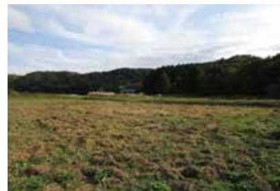
▲株竹さんが借り受けた農地