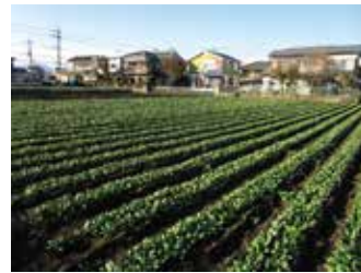
▲適正に利用されている農地

また、農地の貸借を希望する場合は、農林課（電話：042-620-7250）または農業委員会事務局（電話：042-620-7402）までご連絡ください。