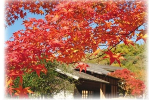
夕やけ小やけふれあいの里 紅葉