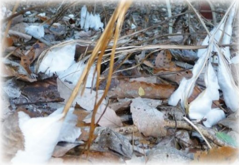
夕やけ小やけふれあいの里 霜の花