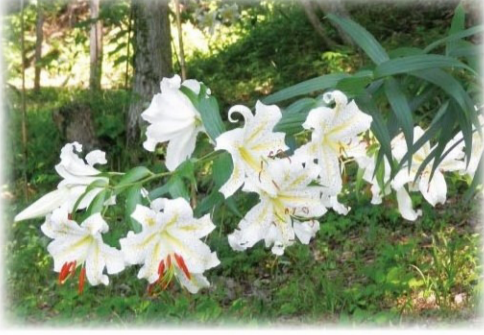
上川の里 ヤマユリ