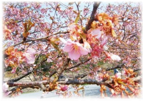
小田野中央公園の河津桜