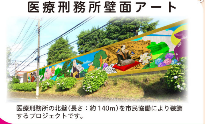
医療刑務所の北壁(長さ:約140m)を市民協働により装飾するプロジェクトです。