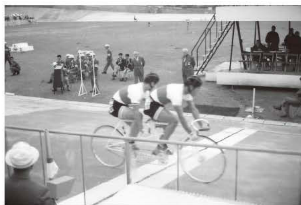
写真2 タンデムスクラッチレース

1チーム4人がチームごとに1分おきにスタートし、109.893km(1周36.631kmのコースを3周)を走る。チーム中の完走した3人目の選手の記録(タイム)で順位を争う。