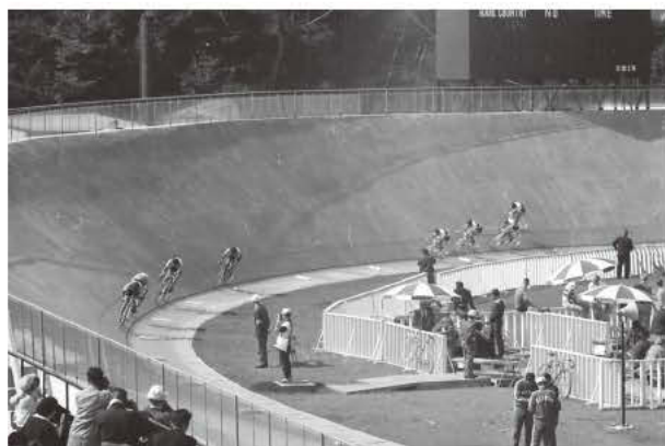
写真1 4000m団体追抜のレース

【実施種目】当時のオリンピック自転車競技の種目は、大別すると競技場(トラック)で行うピスト競技と一般道路を使用するロードレースがありました。ピスト競技は現在の陵南公園に建設されたバンクで以下の5種目が、ロードレースは八王子周辺の一般道を使用して個人と団体の2種目が行われています。