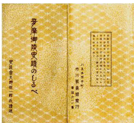
『多摩御陵史蹟のしるべ』

大正15年(1926)12月25日に大正天皇が崩御し、元号は昭和と改められました。これまでの天皇陵は近畿地方を中心としていましたが、昭和2年1月3日に東京府南多摩郡横山村・浅川村・元八王子村(現・ とどり 廿里町・長房町・元八王子町の