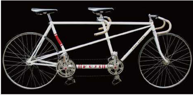
写真3 日本チームのタンデム自転車

【実施日程】八王子競技場には隣接して選手村の分村がおかれ、38カ国、宿泊者数では408人が利用しました。代々木の本村と同じく9月15日に開村し、17日にはスペインチームの一行11名が早々に入村しています。各国のチームは用具の点検やコースの下見、練習等に費やし、10月14日からの試合に臨みました。自転車競技は残念ながらあまり天候には恵まれず、特にピスト競技は雨のため予定を変更しながらの運営となりました。それぞれの競技の実施日は以下の通りです。