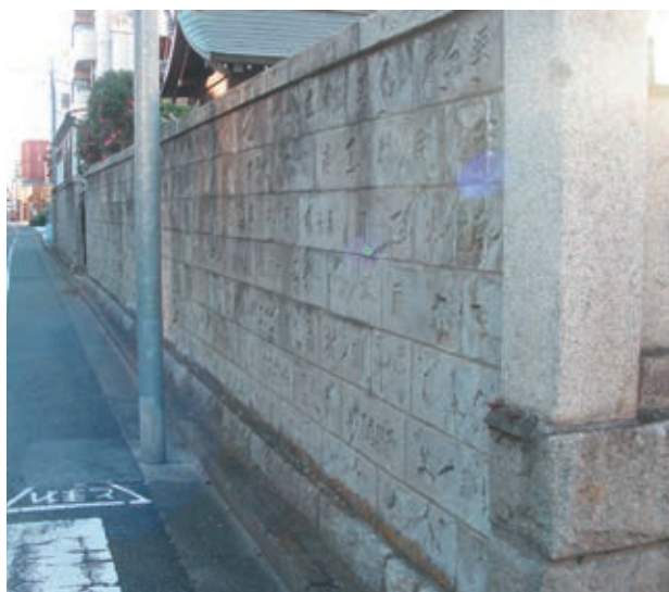
写真1 南塀外側（南側から西方向）

石塀は 7 段積、基礎から笠木までの高さは約 2 m、寺の敷地の南から一部西側にめぐっています。南塀は一部失われていますが長さ 23.46 m、西塀は 3.96 m が現存しています。延べ石に使用されている「伊豆青石」は凝灰岩系統の軟らかい石で、加工しやすく耐火性もあるのが長所ですが、風化しやすいという欠点があります。傳法院の石塀も、剥落して刻銘がわからなくなってしまう部分があります。