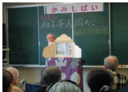
紙芝居「日光と千人同心」の初上演会