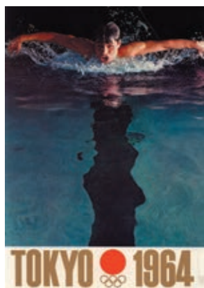
写真3：第3号ポスター