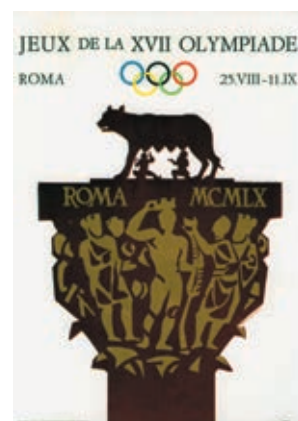
写真6：1960年ローマ大会のポスター（「世界各国オリンピックポスター集」日本書籍出版協会）

参考資料：「オリンピック東京大会 資料集8 報道部」財団法人オリンピック東京大会組織委員会、「世界各国オリンピックポスター集」日本書籍出版協会、野地秩嘉『東京オリンピック物語』小学館 2011