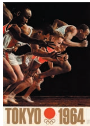
写真2：第2号ポスター