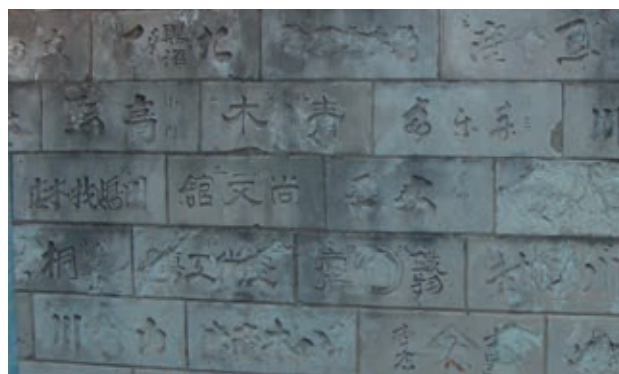
写真3 南塀外側（正面から）