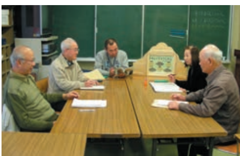
紙芝居メンバーによる打ち合わせの様子