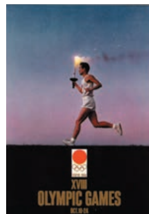
写真4：第4号ポスター