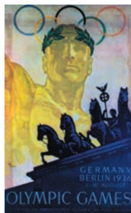
写真5：1936年ベルリン大会のポスター（「世界各国オリンピックポスター集」日本書籍出版協会）