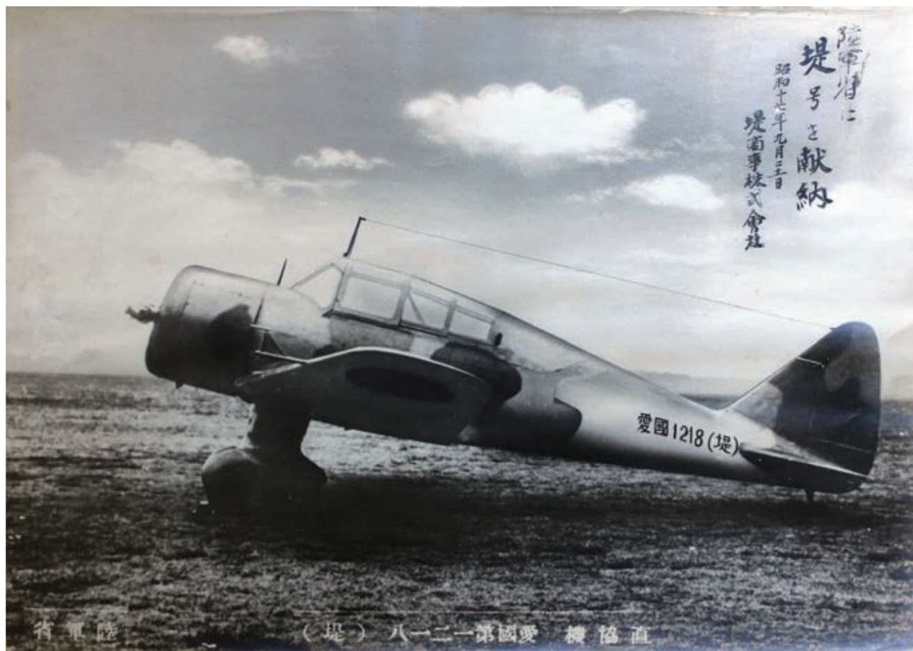
古い写真を読む ②⑥ 八王子の献納飛行機 (昭和 17 年)