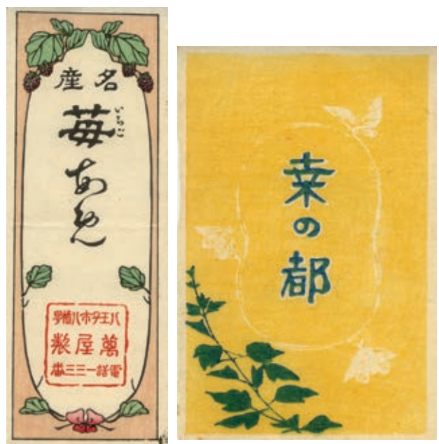
写真：「産名苺あめ」(左)と「桑の都」(右)の商標 小林 直之氏蔵