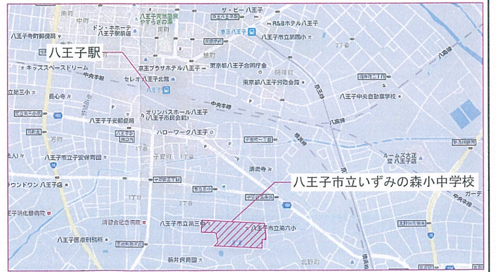
案内図 No Scale