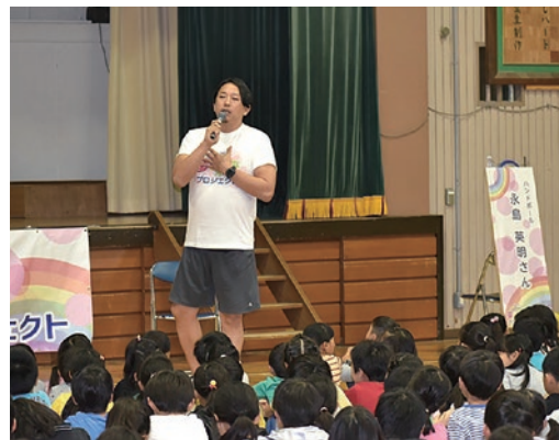
「将来の夢」をテーマに

また「将来の夢」をテーマに、「日々の目標を立てて本気で取り組むこと」や「自分の夢を公言することで、夢への大きな一歩となる」など、夢をかなえるために大切なことについてお話を聴きました。子どもたちは「将来の夢に向かって、小さなことでも努力を怠らず本気で取り組みたい」などと話していました。