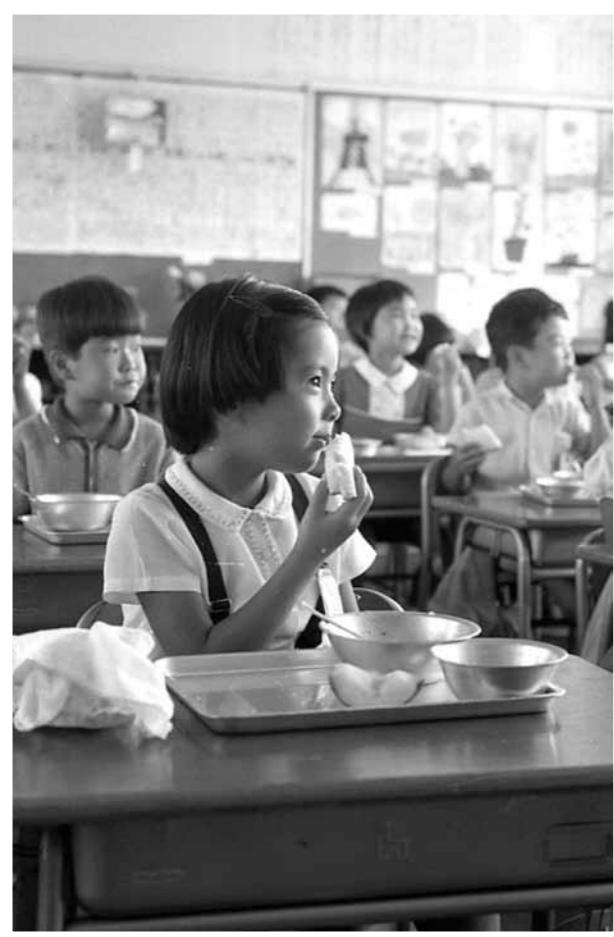
▲いつの時代も楽しみな給食の時間(中野北小学校/昭和44年)

八王子市が誕生して今年で100年。今号では、学校と地域の100年の歩みを写真とともに振り返ります。皆さんが住む地域や学校の歴史について、学校や郷土資料館などに残る写真や資料を調べてみてはいかがでしょうか。問い合わせは学校教育政策課(☎620・7403、☎627・8811)へ。