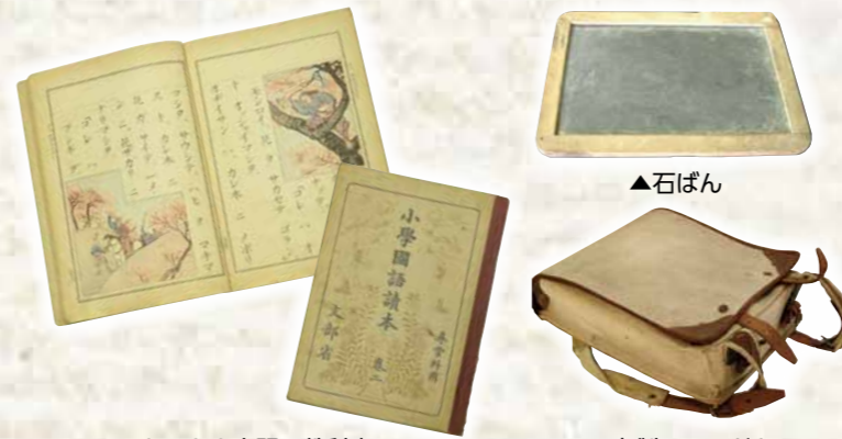
▲カタカナ表記の教科書