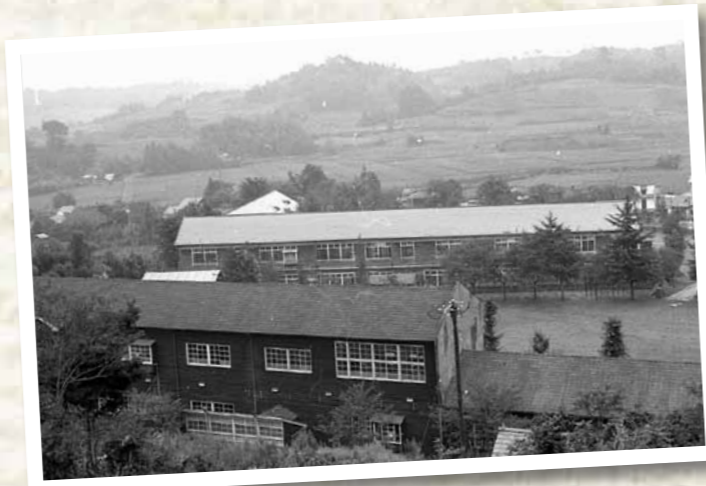
▲開発前の由木地域(由木中央小学校/昭和39年)

当時の学校の周り是一片が田んぼで、下駄では歩きにくい道ばかり。それがニュータウン開発で、高層住宅が建つなど、風景は大きく変わりました。それでも、昔のまま残る自然豊かな里山や人とのつながりを感じるこの地域が大好きです。