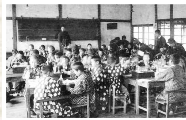
▲着物に下駄姿で(恩方第一尋常高等小学校/大正12年)

大正の初め〜昭和の初め 学校での子どもたち 八王子市が誕生した大正6年。この頃から昭和初期にかけて、学校での子どもたちはどのような生活をしていただのでしょうか。学用品は革や布製のランドセル、肩掛けのカバンなどに入れて通学。服装は詰め襟の学生服やセーラー服、着物に下駄履き姿の子どももいました。授業では「国語」や「理科」、「地理」のほか、算数にあたる「算術」や音楽にあたる「唱歌」などを学習しました。また、当時は紙が貴重だったため、兄弟姉妹で同じ教科書を使用。ノートの代わりに、何度も書き消しができる「石ばん」や「紙製ばん」を使って勉強しました。