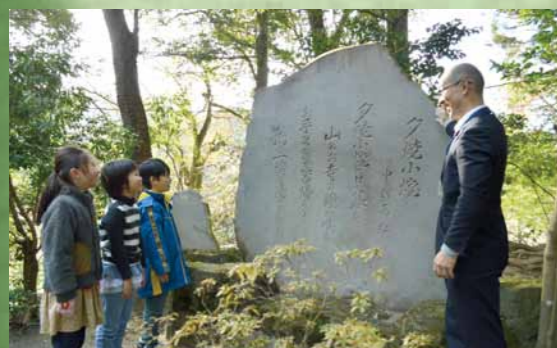
▲童謡「夕焼小焼」の碑の前で

地域にゆかりのある人物や自然環境、郷土料理などについて学習し、八王子のよさを未来に継承します。