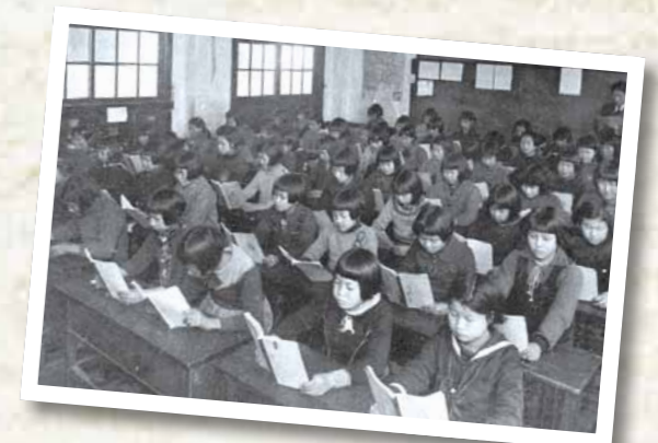
▲一つの机に2人で並んで(昭和14年の八王子第一尋常小学校の卒業記念写真帳から)

大正の初め〜昭和の初め 学校での子どもたち 八王子市が誕生した大正6年。この頃から昭和初期にかけて、学校での子どもたちはどのような生活をしていただのでしょうか。学用品は革や布製のランドセル、肩掛けのカバンなどに入れて通学。服装は詰め襟の学生服やセーラー服、着物に下駄履き姿の子どももいました。授業では「国語」や「理科」、「地理」のほか、算数にあたる「算術」や音楽にあたる「唱歌」などを学習しました。また、当時は紙が貴重だったため、兄弟姉妹で同じ教科書を使用。ノートの代わりに、何度も書き消しができる「石ばん」や「紙製ばん」を使って勉強しました。