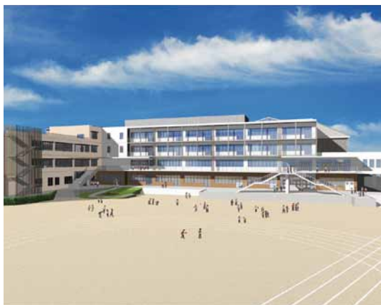
▲いずみの森小中学校新校舎のイメージ図

今後も地域と連携を図りながら、小・中学校9年間にわたる教育環境の充実と地域の核となる学校づくりを進めていきます。