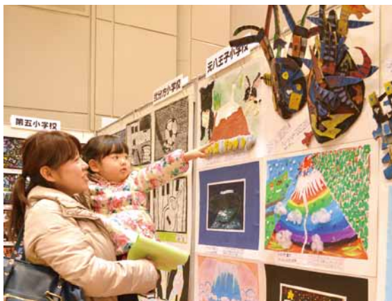
▲感性豊かな作品を一堂に

日時 1月26～30日の午前10時～午後8時(30日は3時30分まで) 会場 エスフォルタアリーナ八王子