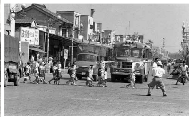
▲子どもを見守る姿は今も昔も変わらず(八日町の交差点/昭和35年)

昭和の中頃〜平成の初め 時代が変わっても 本市はこれまで9つの町村と合併の移り変わりとともに子どもたちの教育環境も変化してきました。昭和37年には、小学校で主食・おかず・ミルクが揃った給食の提供を開始しました。昭和40年代後半からは、市内各地で宅地開発が盛んに人口増加にともない子どもたちも増え、新たに多くの学校を開校しました。この頃から校舎は、木造から耐火構造の鉄筋コンクリート造となり、より安全な学びの場を整備しました。時代が変わっても変わらないものもあります。子どもたちの健やかな成長や、安全・安心な学びの場を守る思いは今も地域に根付いています。