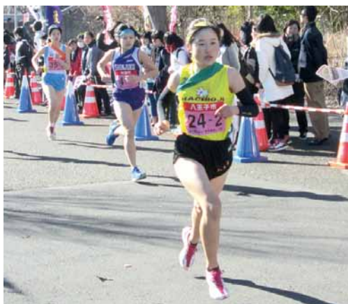
▲ゴールに向かってたすきをつないで

開催日 2月5日(日) スタート時間 女子の部：午前10時、男子の部：午後1時 会場 味の素スタジアム(調布市)、都立武蔵野の森公園特設周回コース(府中市・調布市・三鷹市)