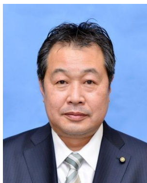
教育長 安間 英潮 (やすま ひでしお)