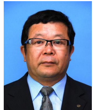
教育長 坂倉 仁 (さくら ひとし)