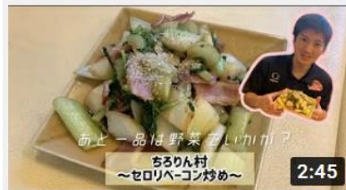
あと一品は野菜でいかが？ 【セロリペーコン炒め】