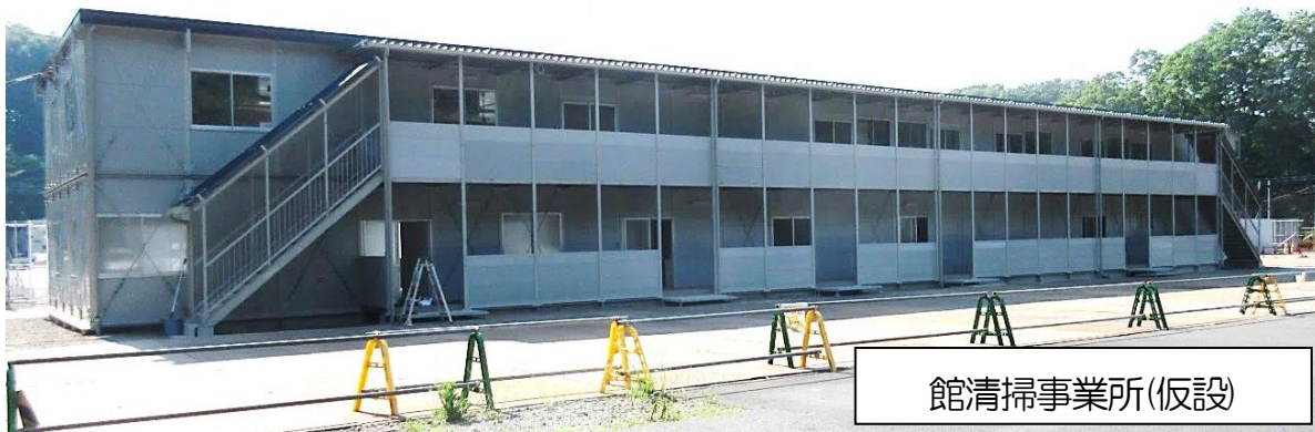
館清掃事業所(仮設)

(仮称)新館清掃施設建設工事に伴い、館清掃事業所は約1年間、同敷地内の仮設事業所にて業務をおこないます。敷地内は、工事車両、収集車両が走行している場合がありますのでご注意ください。住民の皆様にはご不便をおかけしますが、安全には十分配慮してまいりますので、ご理解ご協力よろしくお願いたします。