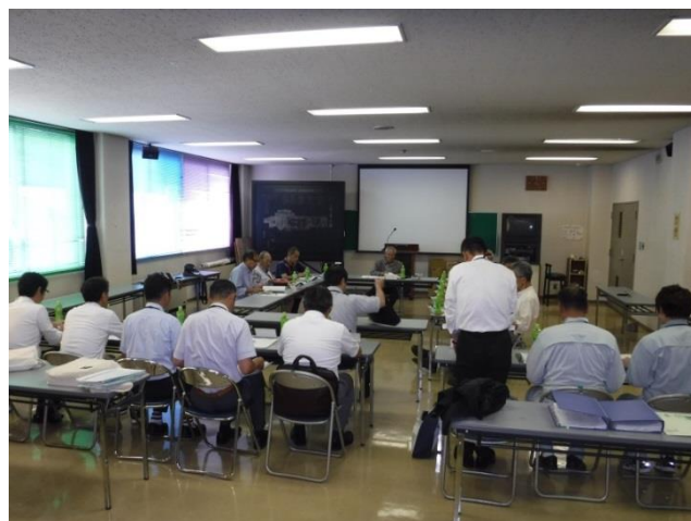
運営協議会の様子

6月19日(火)に平成30年度第1回館清掃工場運営協議会を開催しました。そこでは市民の皆さんが利用できる多目的スペースの設置に関して議論しました。下図のような2つの案の多目的スペースを設置したいと考えております。