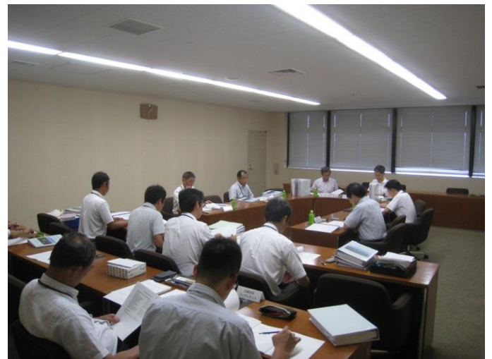
第5回評価会議の様子