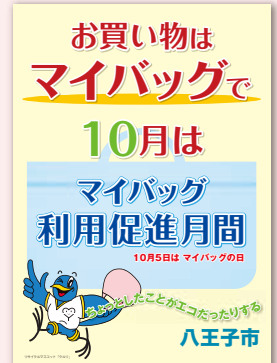
▲ポスターもまちのあちこちから呼びかけます。