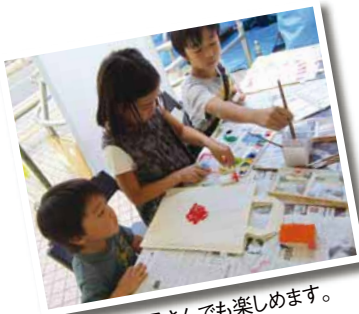
▲小さいお子さんでも楽しめます。

日時：10月4日(日) ※小雨決行 午前11時～午後4時 会場：JR八王子駅北口 東急スクエア 西側スペース 内容：・出た目の数で景品がもらえるサイコロゲーム ・布製のバッグに専用の絵の具で絵や文字を描き、オリジナルマイバッグを作成(先着200名様・無料)など