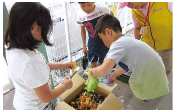
▲細かく切って入れると分解が速くなるよ!

昨年度に引き続き、式分方・大和田・鹿島小学校では、児童がダンボールコンポストに取り組んでいます。今年度から地域のボランティアの方々がお手伝いに来てくださり、小学校を中心に生ごみ資源化の輪が広がっています。