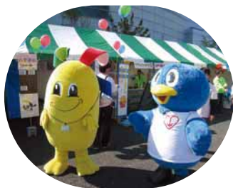
▲「ブクリン」と「クルリ」もお待ちしております！

清掃工場の特別見学会、環境に関する展示のほか、踊りや大道芸などのステージ、迷路や楽しい工作体験コーナー、食べ物のお店などがあります。