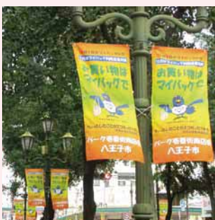
▲商店会街路灯から呼びかけるペナント