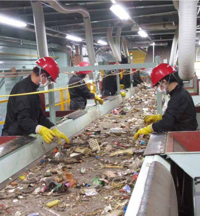
▲戸吹不燃物処理センターにおける手選別作業

■発行/ごみ減量対策課 〒192-8501 元本郷町三丁目24番1号 ☎620・7256(直通) ☎626・4506 ホームページアドレス http://www.city.hachioji.tokyo.jp/gomi/index.html