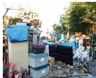
▲不用品回収業者の不適正保管状況

家庭から出る家電製品や粗大ごみなどを、無料または格安で引き取るなど、チラシや拡声器で呼びかけて回収する業者がいます。こういった回収業者による高額な処理費の請求、回収した不用品の不法投棄や不適正保管などの違法行為が問題になっていきます。トラブルに巻き込まれないためにも利用しないでください。