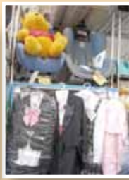
▲男の子用、女の子用、それぞれかわいい服がたくさん並んでいます。