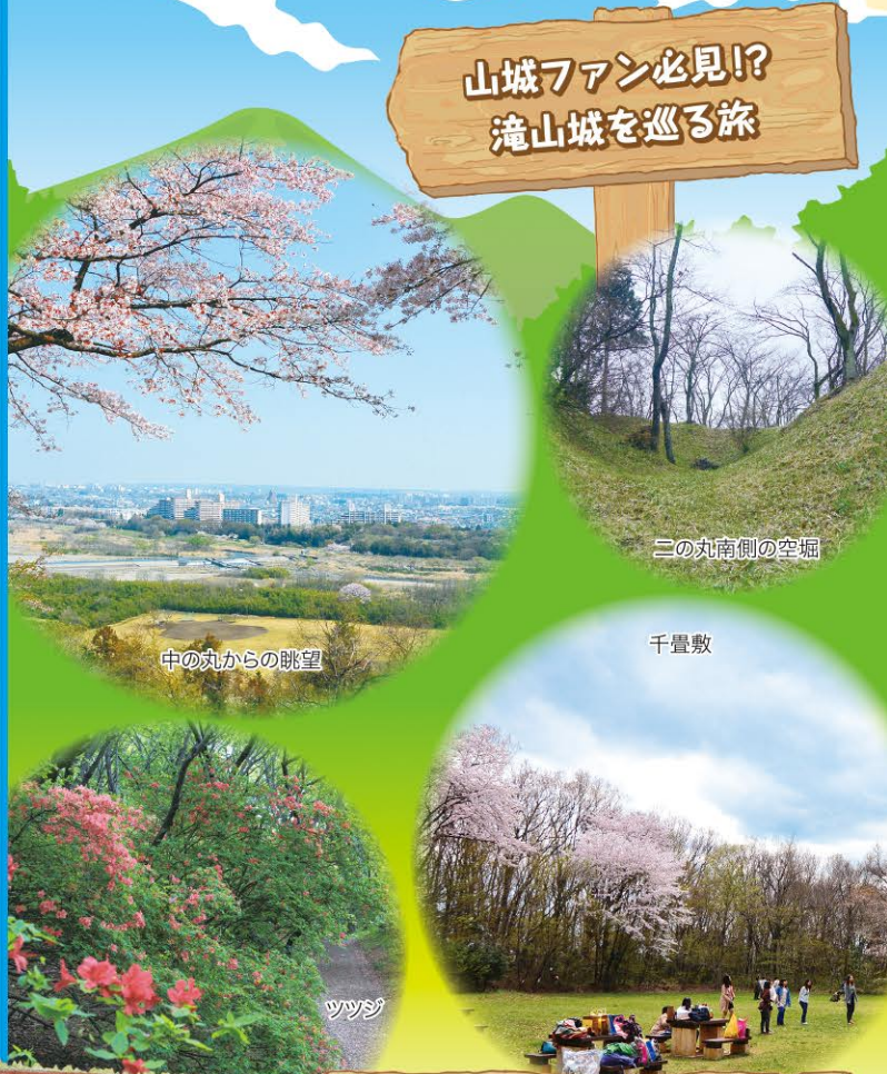
三の丸南側の空堀