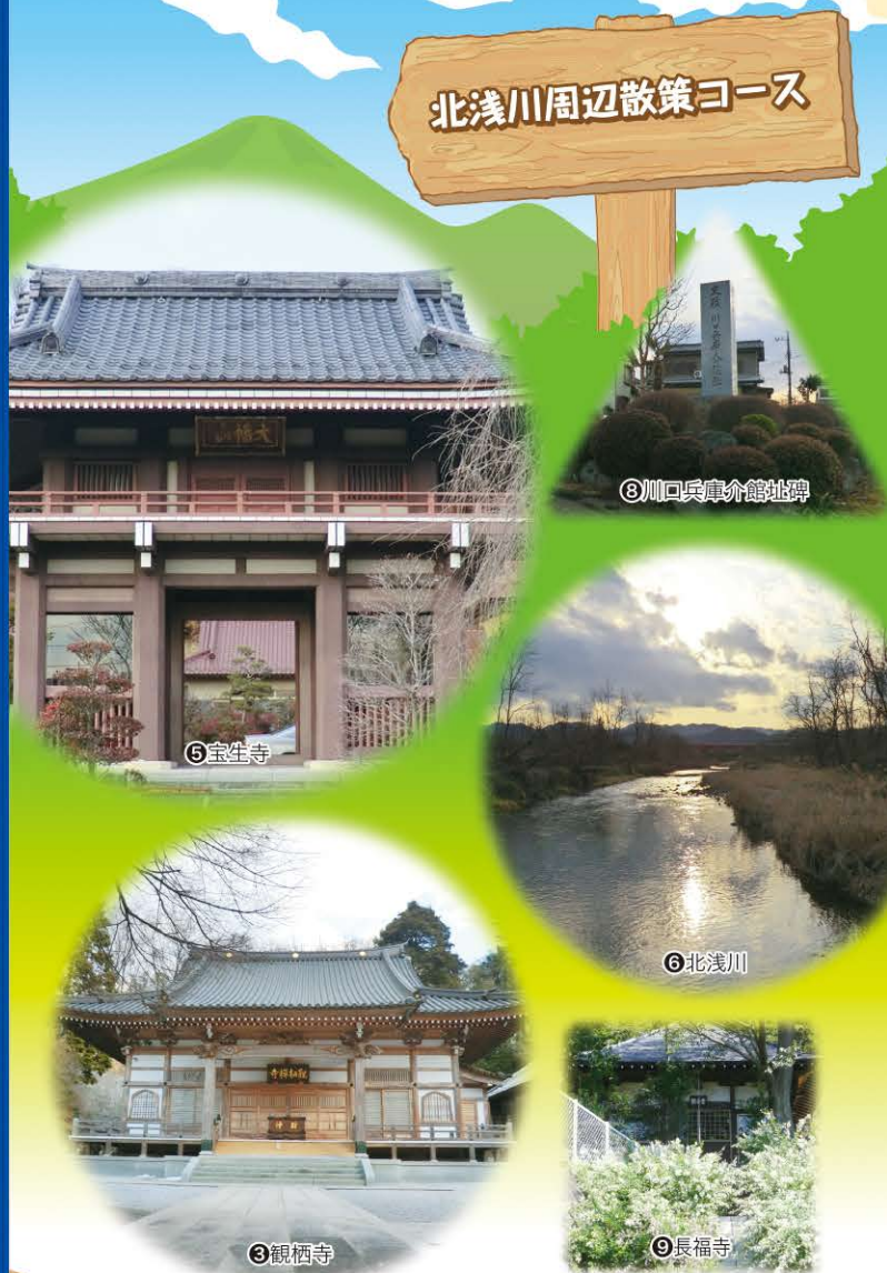
⑧川口兵衛介館址碑