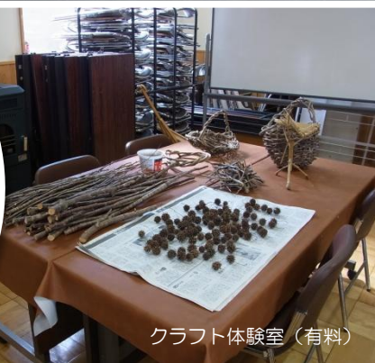
クラフト体験室（有料）