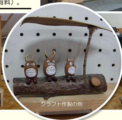
クラフト作製の例