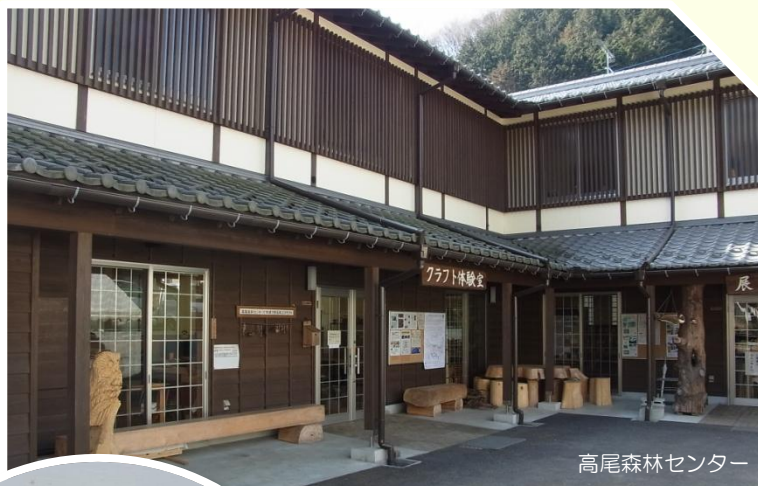
高尾森林センター

国有林を管理する関東森林管理局が、高尾山を訪れる人々に国有林や自然、森林・林業のことなどを知ってもらうために運営する施設です。高尾山にある国有林においてさまざまなイベント活動を行っています。センター内には展示ホールがあり、高尾山の自然や歴史を解説する常駐の解説員（インタープリター）が、展示物の説明や、高尾山の楽しみ方を教えてください。また、クラフト体験室では、木工体験に挑戦できます（有料）。