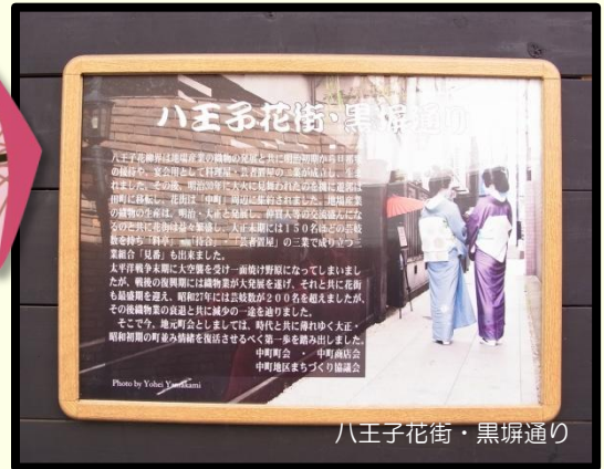
八王子花街・黒塀通り