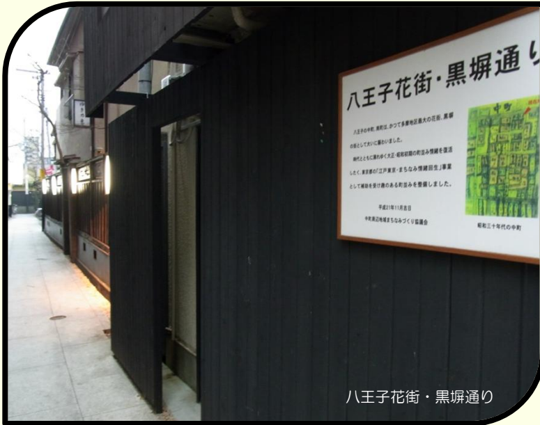
八王子花街・黒塀通り