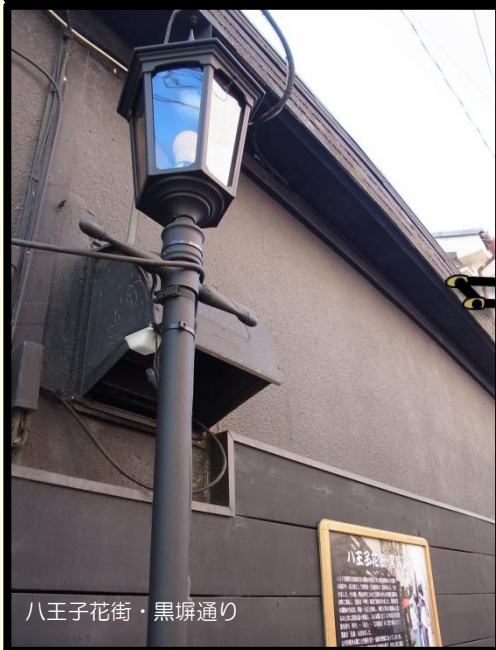
八王子花街・黒塀通り

大正から戦後間もなくまで織物の街として繁栄した八王子の中町界隈には、多摩地域で唯一の花街があり、にぎわいを見せていました。繊維業の衰退とともに風前の灯となった花街の伝統を守るべく、有志が「黒塀を楽しむ会」を結成しました。時代とともに薄れゆく大正・昭和初期の街並み情緒を、東京都の「江戸東京・まちなみ情緒回生」事業として補助を受け趣のある町並みが復活しました。柳の植樹運動などを展開し、風情あふれる花街の姿を、今に伝えています。江戸の情緒を今に伝える、美しい町並みを楽しむことができます。