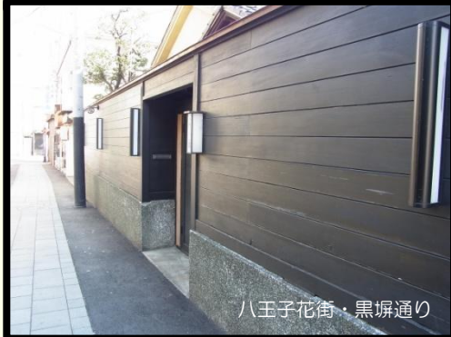
八王子花街・黒塀通り