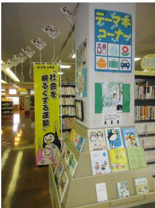
社会を明るくする運動強調月間における図書館テーマ展示