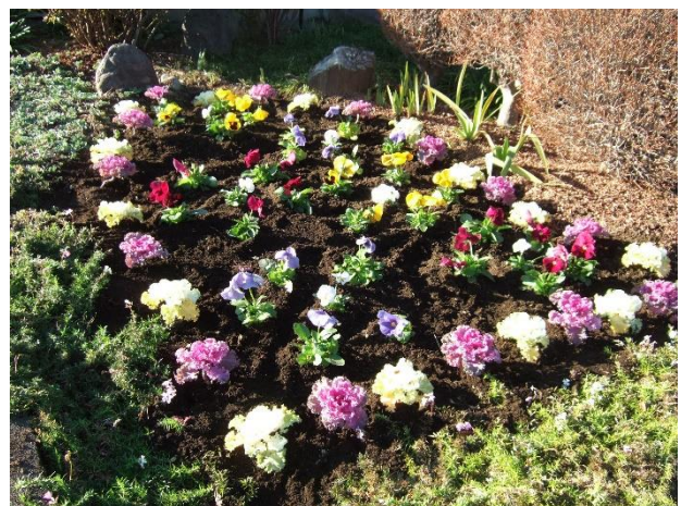
多摩少年院院生による市営霊園整備