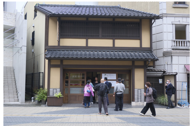
ことこプロジェクトベース(旧矢島染物店)

現在、歴史ある建具や室内の雰囲気なども活かしながら、ことこプロジェクトのテーマや主旨に合う空間づくりを考えています。長く刻まれてきた歴史を大切にしながら、未来志向で地域の孤独・孤立を減らしていく新たな場をつくっていきます。