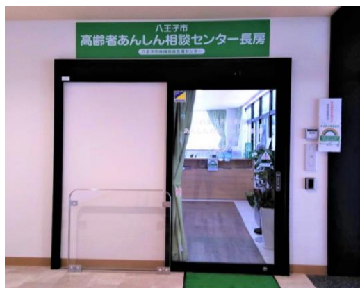
▼高齢者あんしん相談センター長房

開所日 ▼ 月~土 9時~17時 (休日:日、祝日、年末年始※12/29~1/3)