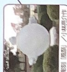
彫刻「風」/小畑高介作

六本杉公園湧水池 八十八景 みどり公園の景 小樹林があり、湧水の量は少ない 池を一周することができ、湧水の量は少ない ですが、静や癒がたいです。