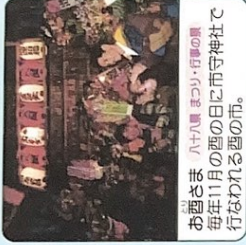
お遊さま 八十八景 まつり・行事の頃 毎年11月の西の日に市守神社で行なわれる西の市。

コース説明：約 7.7 kmコース 所要時間：約 2時間 消費カロリー：約 360 kcal 歩数：約 11,000 歩 八王子駅を中心に八十八景を觀て廻るコースです。季節によって行われるお祭りの名所や街並みの景色、小さなお店などを散策しながら、自分らしい楽しみ方ができるコースです。