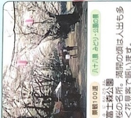
景観100選 八十八景 みどり公園の豊 富士森公園 樹の老成は人出も多 く花見客で賑います。