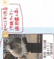
ポイント利用 三井物産 袋那高人家

自然が多く、遊具も たくさんあります。 子どもから大人まで 一緒に楽しめる公園 です。