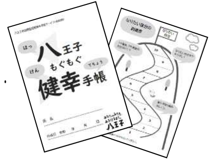
八王子もぐもぐ健幸手帳

食生活が崩れる要因は人それぞれですが、 毎日の食事で、エネルギーをしっかりと摂ることは、 元気に暮らしていくために、非常に重要なことです。