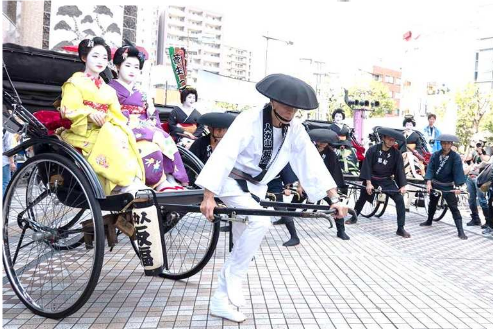
전승의 다마테바코 ~ 다마전통문화페스티벌 2018 ~ 의 모습