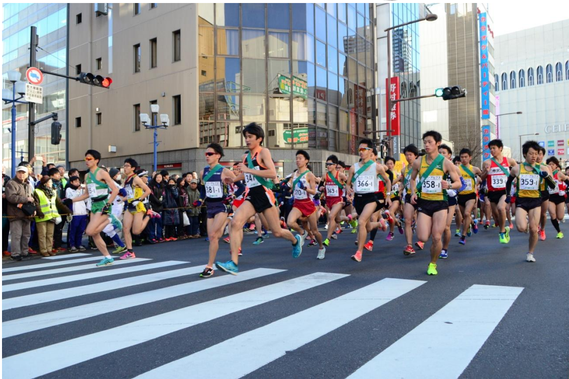
▲ 2월 12일에 개최된 "제 67회 전관동 하치오지 꿈거리역전 경기대회"의 모습