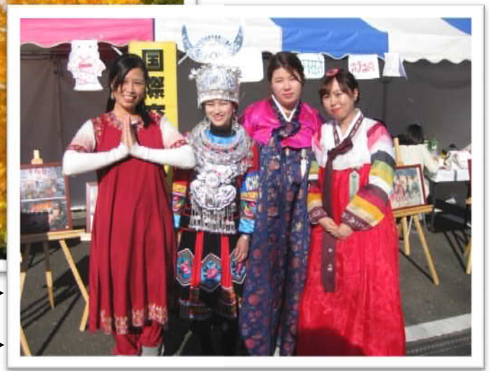
▶平成26年度、国際交流ブースなどを担当し、いちようまつりを盛り上げてくれた外国人留学生 ▶2014년도 국제교류 부스등을 담당하여 은행나무축제 무드를 북돋아 주었던 외국인 유학생