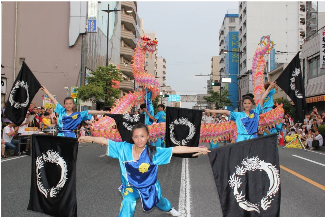
▲ A performance group from one of our friendly cities Kaohsiung City, Taiwan , showed a martial arts dance in Hachioji Festival .