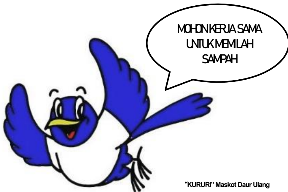
“KURURI” Maskot Daur Ulang