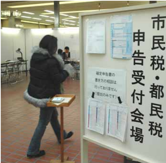
Municipal tax/metropolitan resident tax reporting will start from February 1 st . Income tax reporting will start from February 16 th .