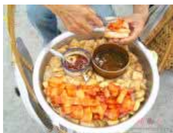
（具を入れて食べる光餅）

海蛎餅（ハイリピンと読む）というのは揚げ物で、具は野菜（主にキャベツか白菜）ネギ、海苔と蛎です。好みで椎茸なども加えます。しかし、蛎を食べられない人もいるので、その代わりに肉を入れることが多いです。