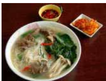
（ビーフンのスープ風）

ビーフン（米粉と表記され、ミーフェンと読む）は日本のとは違い、より細く、切れやすいです。そのため、調理するのが難しいです。焼きビーフンのほかに、ラーメンのように、スープの中で煮込んだりします。これも大好物の一品です。