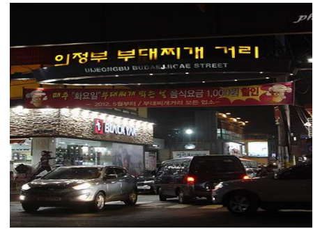
夜の議政府（ウィジョンブ）