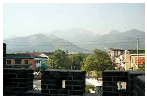
市街地から見た泰山