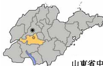
山東省中の泰安市の位置