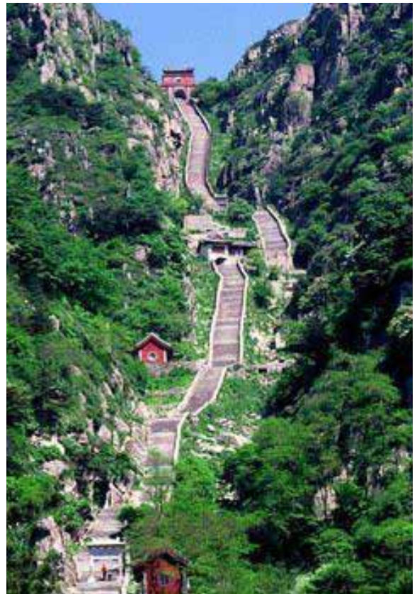
泰山の難所「十八盤」 山頂へと7,000段の階段が続く