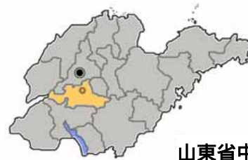
山東省中の泰安市の位置