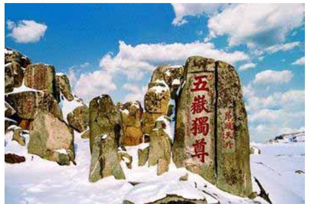
泰山を象徴する石碑「五岳独尊」

泰山は、雄大で壮麗な自然風景と、悠久の輝かしい歴史文化を一体に融合している天然の山岳公園です。日の出、夕焼け、雲海などの自然による奇観は、私たちに驚かせます。1987年には、ユネスコに世界自然遺産、世界文化遺産からなる複合遺産として、登録されています。