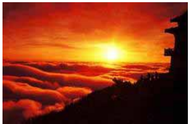
泰山の日の出と雲海