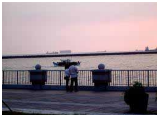
西子湾の夕暮れの様子