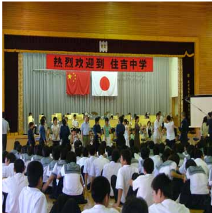
( 2005・葫蘆島市と宮崎市の青少年交流 )