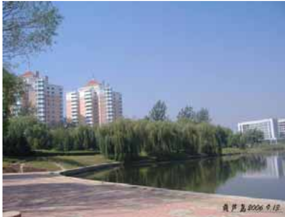
( 葫蘆島市の公園 )