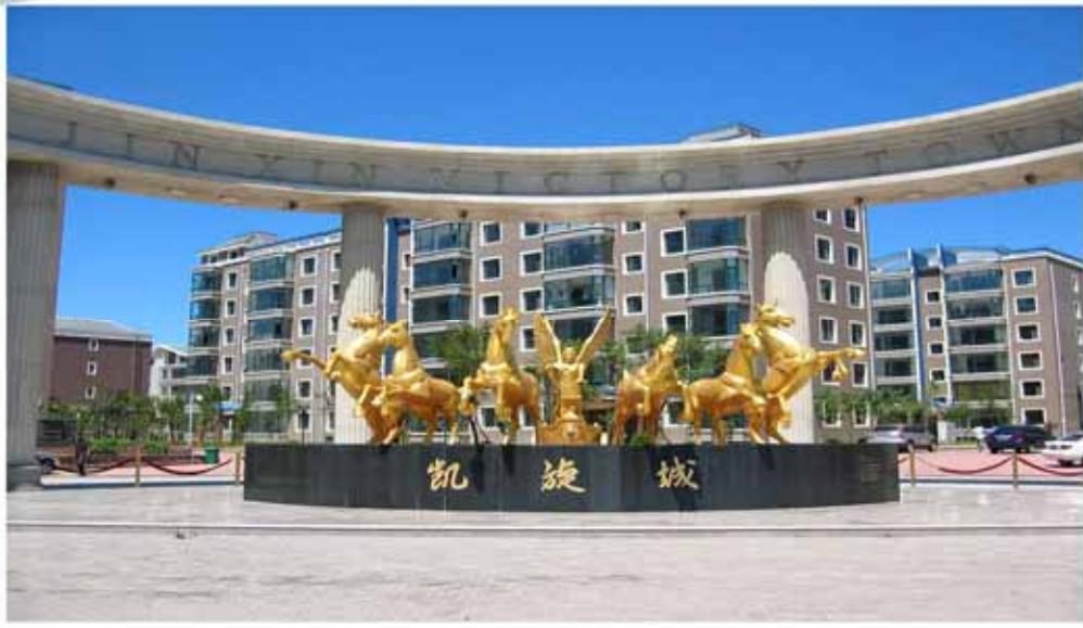
( 葫蘆島市の住宅団地 凱旋城 )

葫蘆島の市民は「魅力的な葫蘆島市」を目指して頑張っています。市は将来に向けての重要性を踏まえ、大きく躍進しています。