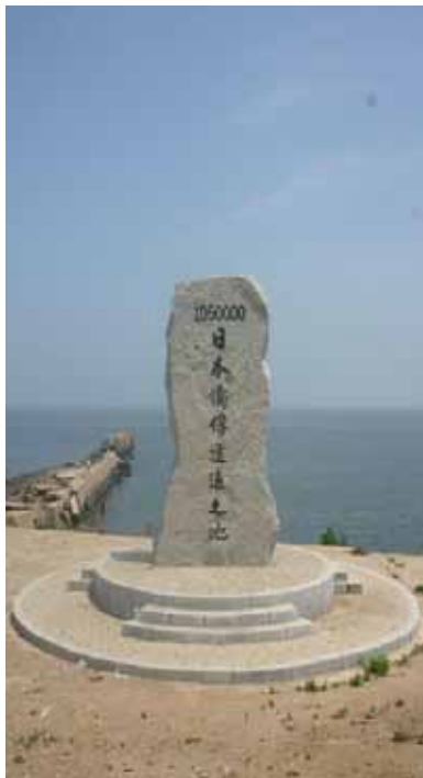
(「日本僑俘遣返之地」の記念碑)