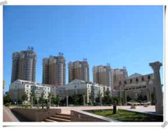
( 葫蘆島市の住宅団地 )

環渤海経済圏の一部として、葫蘆島市は開発区などを設置し、有利な交通をPRしての外資誘致に余念がありません。地下資源が豊富で、鉛、亜鉛、銅、モリブデンなどの採掘が盛んな鉱業都市であり、石油化学工業、金属工業が盛んな工業都市でもあります。