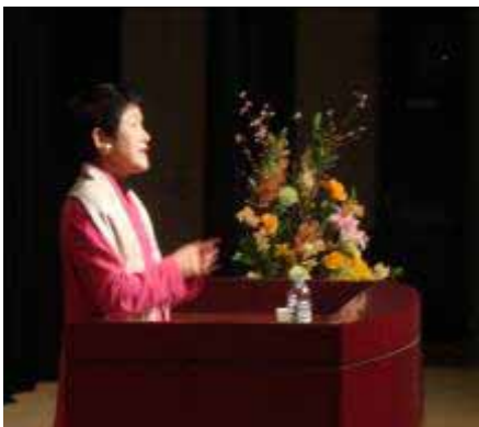
坂東 眞理子 さん

1969年総理府入省。内閣府男女共同参画局長等を歴任し、2007年4月より昭和女子大学学長に就任。「女性の品格」「親の品格」「錆びない生き方」など著書多数。