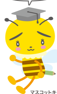
マスコットキャラクターはっちゃん丸