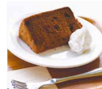
チョコシフォンケーキ