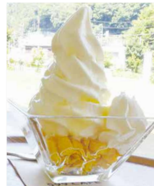
高尾はちみつサンデーは、濃厚なソフトクリームと甘い蜂蜜が絶品です!!