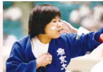
帝京大学柔道部(女子) 副主将 (63kg級)