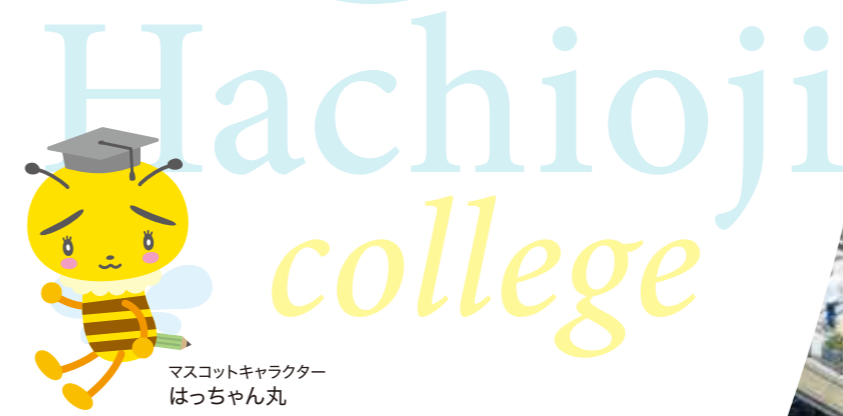
マスコットキャラクターはっちゃん丸