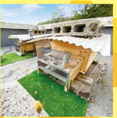
内検ではミツバチの健康状態や蜜の量をチェックします。