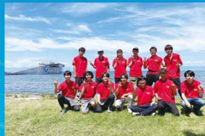
「第44回鳥人間コンテスト2022」に出場したMaPPL

すると、2年生が来年度の機体を作るという流れで毎年行っています。去年まではコロナの影響で新歓自体が無かったのですが、今年は対面できました。チラシ配りや、実際に機体を見てもらい紹介ができたので、たくさん入部してくれました。コロナ禍前は20人前後が毎年入部していましたが、コロナが流行してから部員数が1桁台で止まっています。そのため作業にも大きく影響が出て製作自体が困難でした。人数が少なく作業ができない日もありました。いつもは執行代で完結できるのですが、人手不足で2年生や卒業生にも手伝ってもらいたくさんの協力があり、今大会の機体が完成しました。 機体は一度組み立てを行います。全てが完全に完成するのはコンテスト当日がほとんどです。機体はとも大きいものなので、組み立てはもちろんな、解体するのも大変な作業になります。 今大会は土曜日開催され、MaPPLは前年度優勝チームということもあり最終フライトの予定でした。早い時間にフライトが行われた団体は予定通り進行しましたが、MaPPLのフライトは天候の影響を受け、次の日曜日に延期になってしまいました。すでに組み上げてしまった機体をもそのまま放置することはできないので、チームのみんなで交代で機体を飛ばされないよう抑えたり、見張りとして一晩中機体のそばで待機していました。そのため2〜3時間ほどしか睡眠を取れていないメンバーもいて、とても過酷なフライトになってしまいました。延期になることで滞在期間も増えますし、大会後には定期試験も控えているため、棄権することも検討しました。しかし3年生の意向は全員同じで、「延期でもフライトを行う」といったものでした。1年間鳥人間コンテストに力を注ぎ込んでいた熱い思いがありました。普段MaPPLは機体製作の作業日などは決めていません。メンバーは毎日、授業の後に当然のように作業場所