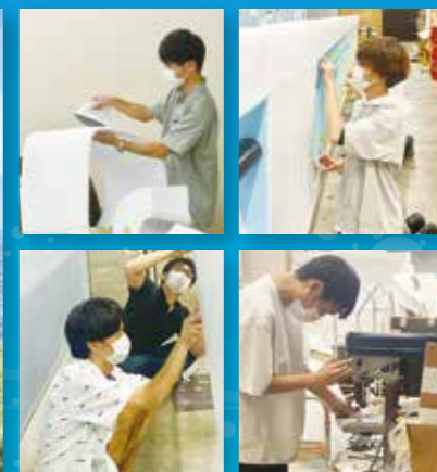
設計から組み立てまで全て手作りで製作する機体

に集まり、黙々と機体完成に向け作業を行います。休みの日もほとんど学校に来て作業をしていました。チーム全員で情熱を注ぎ完成させた機体と、鳥人間コンテストという最高の舞台を前に、フライトを行わないという選択肢は、執行代である3年生たちの中では一切ありませんでした。