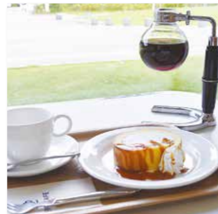
ケーキセット(サイフォンコーヒー)

素材にこだわったケーキは日替わりで、どれもコーヒーとの相性が良い優しい甘さです。コーヒーは、サイフォン式と呼ばれる日常ではなかなか見かける事のない淹れ方です。フラスコを逆さにしたようなおしゃれな見た目をしているコーヒーサーバーで写真映えも間違えなしです! やわらかく風味豊かな味わいが特徴のサイフォン式のコーヒーは、ミルクや砂糖を入れても良いですが、ブラックで香りを楽しみながらケーキをいただくとベストマッチです。