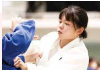
帝京大学柔道部(女子) 主将 (52kg級)