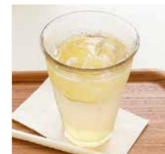
レモンスカッシュ