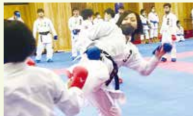
日々の厳しい練習が大会での優勝に繋がります。