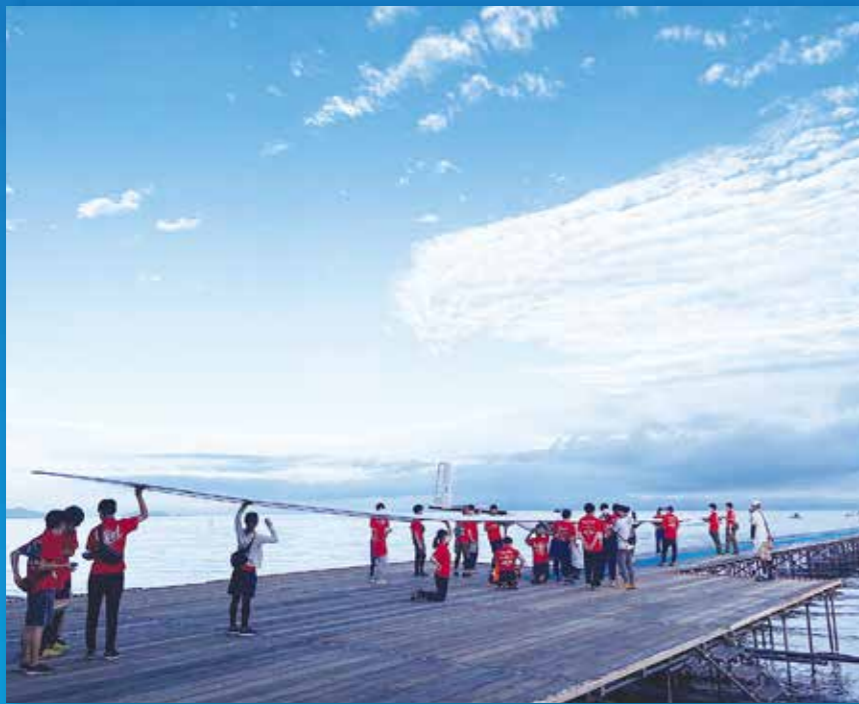
2022年第44回大会では惜しくも6位という成績に終わってしまいましたが、湖面を滑空する機体はとても美しく、高い評価を受けました。

しつかりと名を残しました。「力強い団結力」の代名詞とも言える東京都立大学人力飛行機研究会MaPPLの今後の活躍が楽しみです。 ..... 困難やトラブルにも チーム全員で立ち向かう 4年生が引退した現在のMaPPLの部員数は、3年生が7人(7月の今大会で引退)、2年生が6人、1年生が30人(簡単な作業とパイロットの練習)です。機体の製作をするのは2学年で行います(2年生と3年生)。3年生が引退