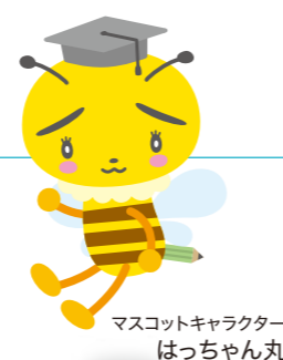
マスコットキャラクター はっちちゃん丸