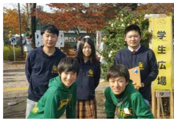
ivusaの皆さんといちよう祭りにて

A. 三ヶ月後にはインド住宅建設活動を行います。さらに、カンボジアでは小学校建設活動を行い、フィリピン、ネパールなどの4カ国に今年も行くことができています。八王子駅前などで小学校建設のための募金活動など行っていて、その寄付金を利用して海外の活動を行っています。