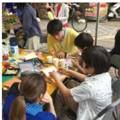
ivusaの活動の一部 国内、海外を問わず多岐に渡る