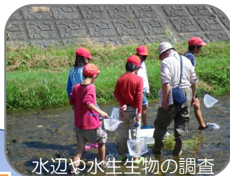
水辺や水生生物の調査