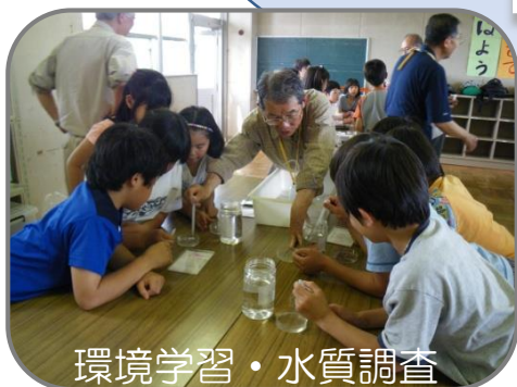
環境学習・水質調査