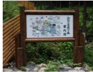
案内板（中央区・HP より）