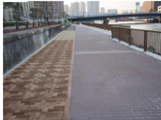
歩道舗装