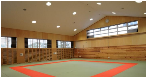
③（第七中学校／武道場）