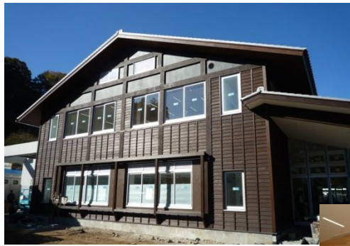
(高尾 599 ミュージアム/外壁)