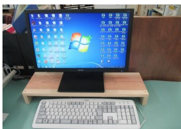
（パソコン台／本庁舎）