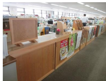
（受付カウンター／本庁舎）