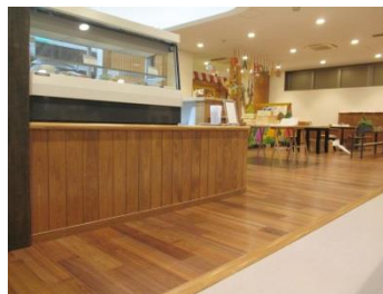
(まちなか交流施設/腰壁・床)