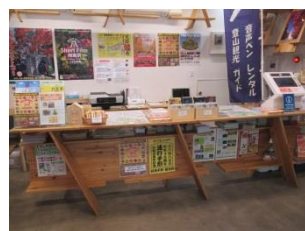
(高尾山口観光案内所/受付カウンター)