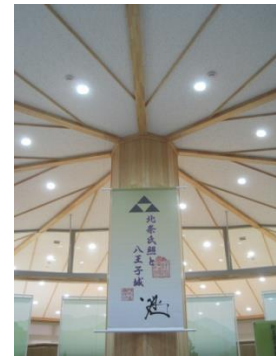
(八王子城跡ガイダンス施設) /内装柱型・梁型