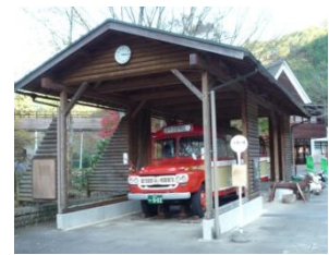
⑥（夕やけ小やけふれあいの里／ 展示物用屋根）