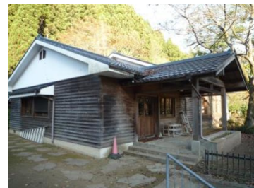
③（恩方第二小学校／多目的教室）