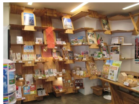
(高尾山口観光案内所/展示棚)