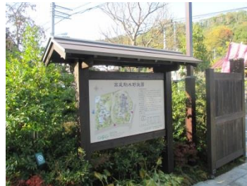
（案内板／駒木野庭園）