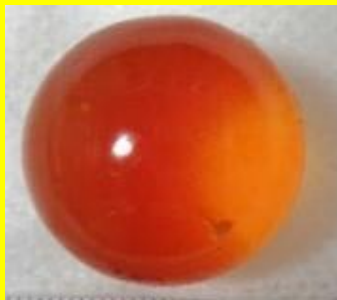
水で膨らむボール (吸水性合成樹脂製玩具)