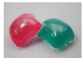
代表的な洗濯用パック型液体洗剤

国内で販売されている代表的な洗濯用パック型液体洗剤は、中性の濃縮液体洗剤を水溶性のあるフィルムで包んだ、触ると柔らかいものです。フィルムは水に溶けやすいため、子どもが握ったり噛んだり遊んでいるうちに、破れてしまうケースが多く、特に3歳以下の乳幼児に被害が集中しています。乳幼児の手の届かないところで保管するよう注意してご使用ください。