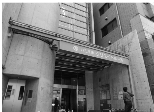
クレイトホール正面入口

八王子市消費生活センターは本年3月、JR八王子駅北口のクレイトホール地下1階（旧八王子駅前事務所）に移転・新装し、3月より市民の皆さんの利用しやすい施設をめざして事業を行っています。