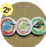
野鳥缶バッジいすれか一つ