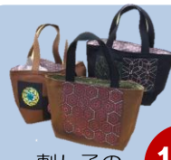
刺し子のトートバッグ