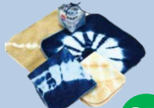
藍染めミニタオル