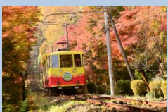
高尾山パック(1,380円相当)

高尾山のケーブルカー(リフト)券、さる園・野草園の利用券がセットになっています。